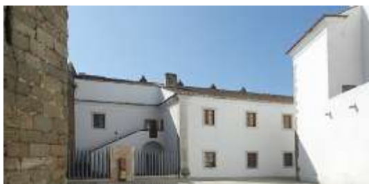
Cuartel del Asiento. Olivenza.