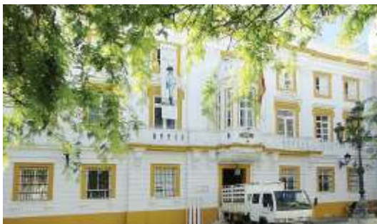
Capitanía General. Badajoz.