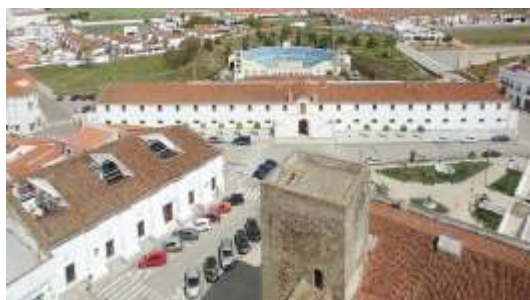
Cuartel de Caballería y de San Carlos. Olivenza.