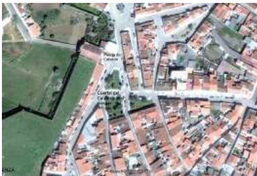
Cuartel del Calvario. Olivenza.

Actualmente, su lugar lo ocupa una amplia plazoleta ajardinada. Al menos, el espacio no ha sucumbido a la voracidad del urbanismo constructivo, obsesionado con la ocupación “innovadora” de los cascos históricos.