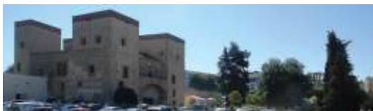
Lugar del desaparecido Cuartel del Castillo. Badajoz.

El Convento de San Agustín fue reutilizado como alojamiento militar entre 1823 y 1925. En un principio acogió a 450 infantes, que serían 750 desde 1860. Desde 1934/36 se destinan a colegio público, juzgados, refugio de indigentes y comedor de Auxilio Social sus amplias dependencias. En 1980 se remodela como nuevo Colegio Público “San Pedro de Alcántara”, conservando un interior de claustros y muros primitivos.