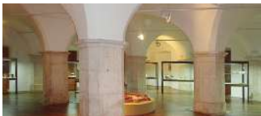
Interior del Cuartel del Asiento. Olivenza.