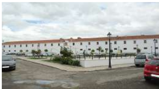
Cuartel de Caballería. Olivenza.