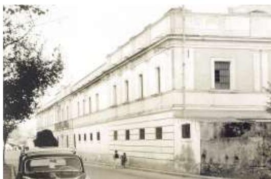
Desaparecido Cuartel de la Bomba. Badajoz.

Comenzado a construir alrededor de 1739, el Cuartel de los Gitanos estaba por encima, al norte, del Convento de Santo Domingo, y del cuartel del mismo nombre. Acogió a unos 200 infantes en 1796, pasando a 90 caballos atendidos por