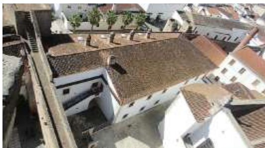
Cuartel del Asiento. Olivenza.