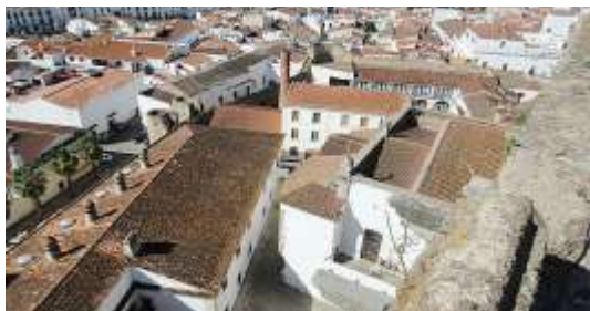
Cuartel del Asiento (izquierda) y del Pozo (en frente). Olivenza.