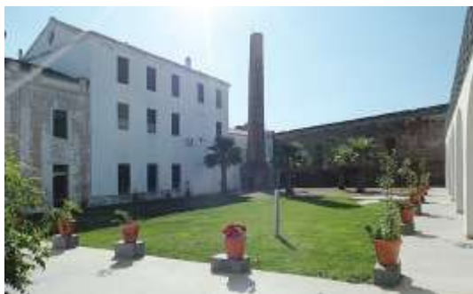
Interior del Cuartel del Pozo. Olivenza.