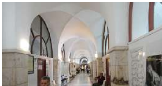
Planta Baja del Cuartel de Caballería. Olivenza.